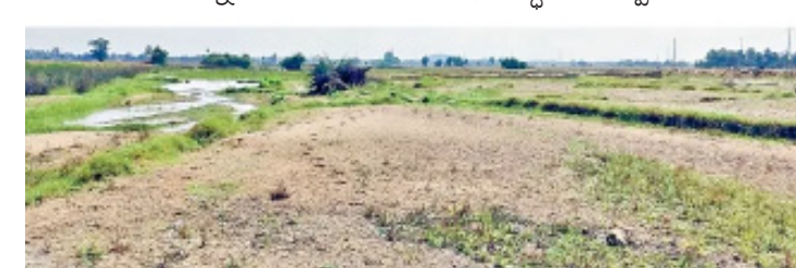
పనుల్లో ముందడుగు పడకుండా చేస్తున్నాయి.

మరిపెడ మండలం ధర్మారం గ్రామంలోని వంతెన వరదకు కొట్టుకుపోయింది.. పునర్నిర్మాణ పనులపై పురోగతి లేదు. ధర్మారం వాసులు ఖమ్మం వైపు వెళ్లటానికి.. అటువైపు వారు మహబూబాబాద్ వైపు రావటానికి దూర ప్రాంతం నుంచి తిరిగి రాకపోకలు సాగించాల్సి వస్తోంది.