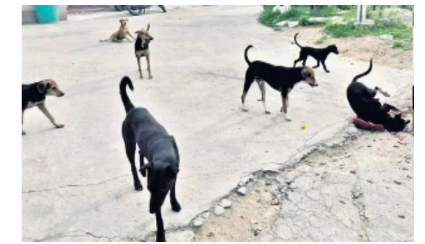
వీధి కుక్కల సంఖ్యను తగ్గిస్తాం.

భువనగిరి టౌన్, జిల్లా కేంద్రం భువనగిరి పట్టణ ప్రజలను వీధి కుక్కలు భయపెడుతున్నాయి. ఒంటరిగా నడుచుకుంటూ వెళ్లినా, బైకులపై వెళ్లినా వీధి కుక్కల గుంపు భో భో అని బిగ్గరగా భయపడేలా అరుస్తూ వెంటాడుతున్నాయి. దీంతో విద్యార్థులు పాఠశాలలకు వెళ్లేందుకు జంతువులను పరిస్థితి. పలువురు మహిళలు మార్కెట్ వాక్ మానివేశారు. పలువురు వీధి కుక్కల దాడిలో గాయపడుతూ రేబీన్ ఇంజక్షన్ కోసం ఆస్పత్రుల బాటపడుతున్నారు. మరికొందరు కాళ్లు, చేతులు విరిగి నెలల తరబడి బెడ్ కు పరిమితమవుతున్నారు. దీంతో తాము ఎదుర్కొంటున్న ప్రధాన ఇబ్బందుల్లో వీధి కుక్కల సమస్య మొదటిదిగా పలువురు పేర్కొంటుండటం కుక్కల సమస్య తీవ్రతను తెలియజేస్తోంది. వీధి కుక్కల అదుపునుకు వాటి పునరుత్పత్తిని నియంత్రించే లక్ష్యంతో రూ.45 లక్షల వ్యయంతో పట్టణ శివారులోని హన్మంతుల్లో నిర్మించిన జంతువుల శస్త్రచికిత్స కేంద్రం ఆర్యాటానికే పరిమితమయింది. దీంతో వీధి కుక్కల నియంత్రణపై అధికారులు ప్రేక్షక పాత్రకే పరిమితమైన పరిస్థితి. వీధి కుక్కల విజృంభణ ఇలాగే కొనసాగితే సమీప కాలంలో మరింత భయంకరమైన పరిస్థితులు నెలకొంటాయని ప్రజలు ఆందోళన చెందుతున్నారు. అధికారులు వీధి కుక్కల నియంత్రణకు చిత్తశుద్ధి చూపాలని కోరుతున్నారు.